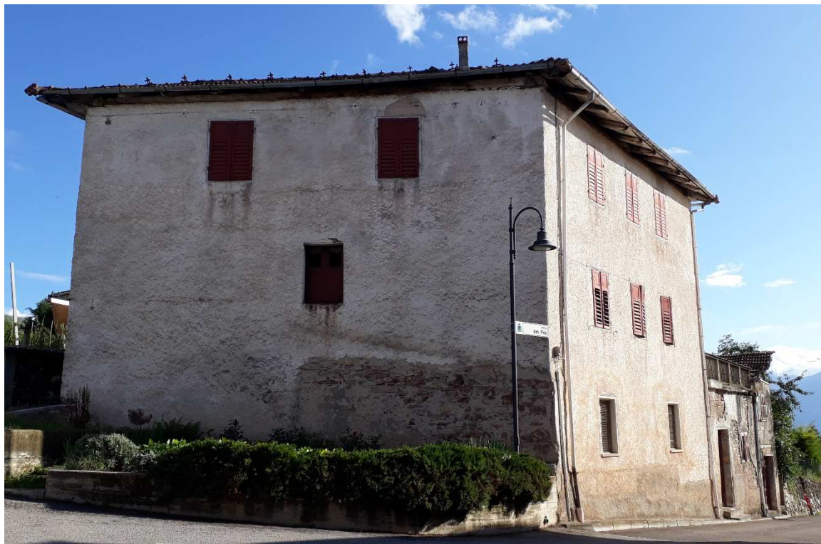
Vista da nord