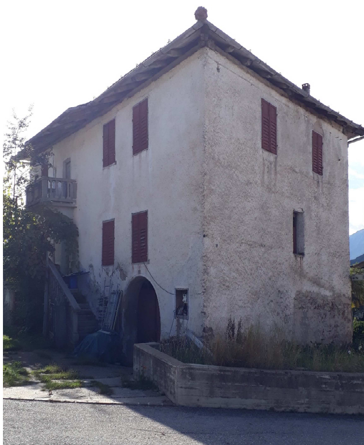
Vista da est